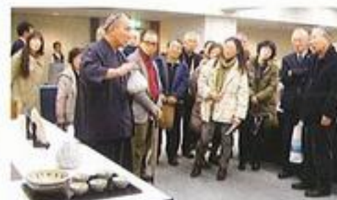
飯田雪峰審査員による作品解説