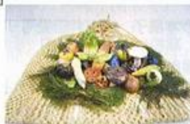
命を支えるベジタブル