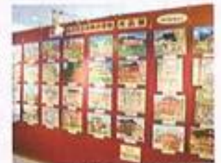
★金沢市立中央小学校 作品展 (1/22～2/21)

この他にも随時、教育関係団体の活動紹介や写真展、児童の作品展示なども行っています。ぜひ、お立ち寄りください。