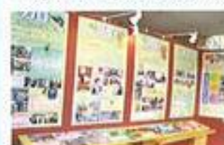
▲県立七尾特別支援学校

「地域に愛され、地域を愛す～繋がる・広がる・そして輝く～心の教育の充実から基礎学力の定着へ」