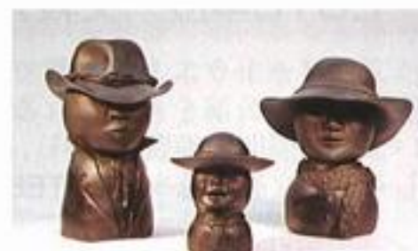
パパとママとボク

審査員寸評 「加賀野菜のおいしさ。大地の温もり。大地の地下にかくれている味と形。うまく表現されていて、釉薬のあつかいもいいですね。」